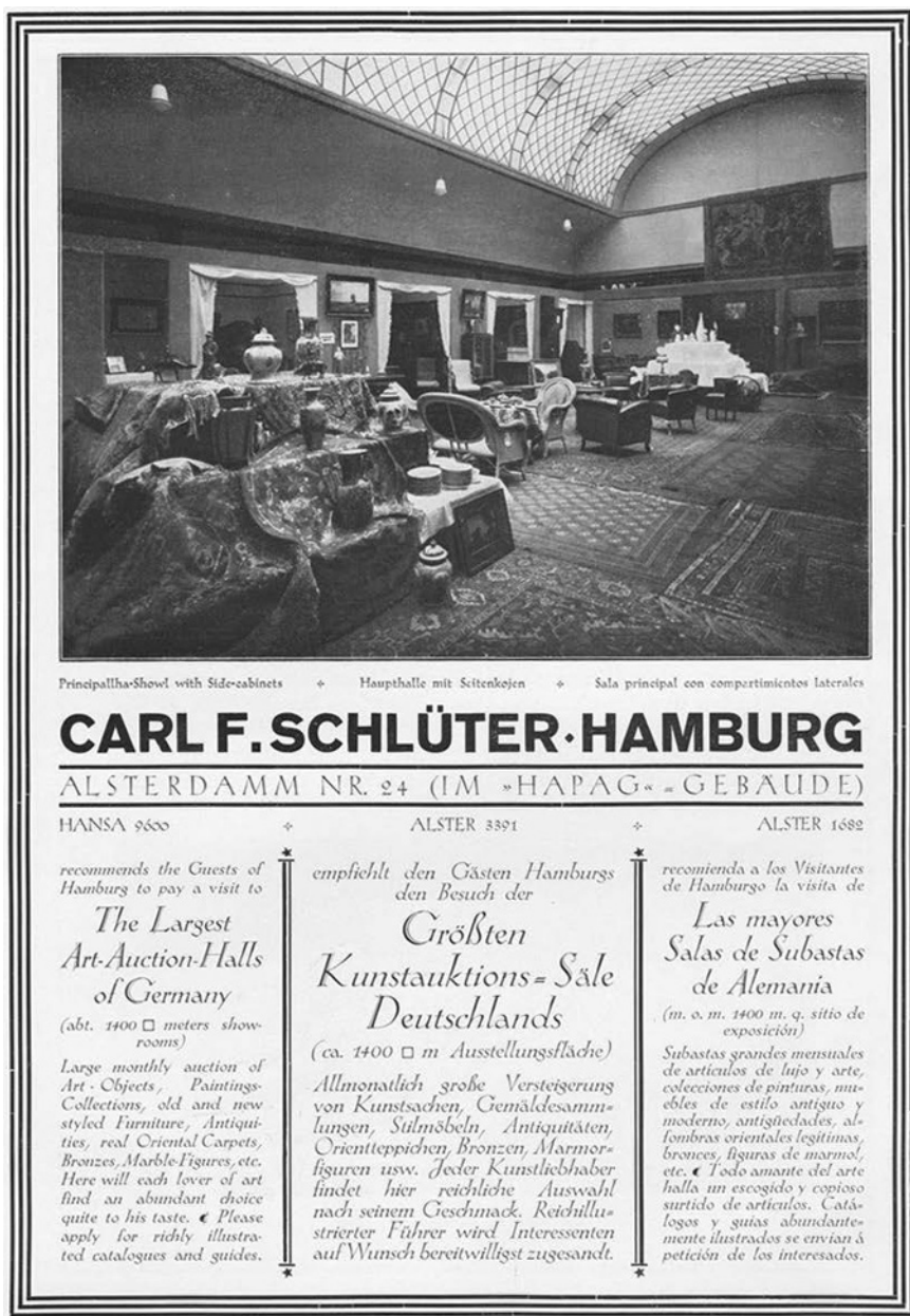
Abb. 1: Carl F. Schlüter, Hamburg. Werbeanzeige von 1926.

Nicht für jede von Carl F. Schlüter durchgeführte Versteigerung, aber für einige, wurde eine Werbeanzeige in den lokalen Hamburger Tageszeitungen geschaltet. Darunter finden sich sowohl Versteigerungen des Hab und Gutes deportierter Hambur-