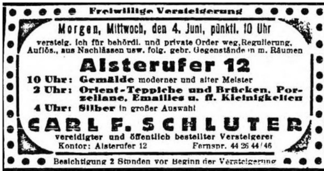
Abb. 10: Versteigerungsanzeige Auktionshaus Carl F. Schlüter. (Hamburger Anzeiger vom 3. Juni 1941)

Albers - Gemälde versteigert freiwillig am Freitag, 21. November, 11 Uhr, in seinen Räumen Altona, Reichenstraße 37, Ecke Bachstraße, Linie 4, 13, 31, in behördlichem Auftrage ca. 240 Ölgemälde alter und neuer Meister. Ferdinand Albers, vereidigter und öffentlich bestellter Versteigerer, Kontor Altona, Bachstr. 112, Ruf 42 56 48, Kontor Hamburg, Drehbahn 30, Ruf 35 25 67. Besichtigung am Versteigerungstage von 9–11 Uhr