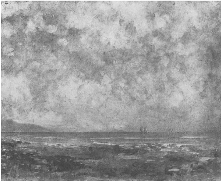
Abb. 9: Gemälde »Gebirgssee« oder »Lac Léman« von Gustave Courbet.

Das Werk listete Carl F. Schlüter für die »Gemälde-Versteigerung« unter der Cavelling-Nummer 8 als Gebirgssee von Couzbet (Abb. 9). Bei der damaligen Identifizierung des Malers durch die Mitarbeiter:innen des Auktionshauses handelt es sich um einen Schreibfehler; richtig ist: Courbet.