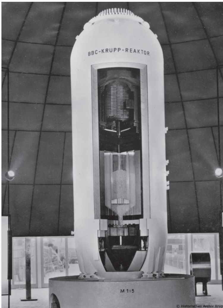
Abb. 2 Ein Prototypreaktor von BB-Krupp Reaktorbau aus dem Jahr 1963.

dige Abteilungsleiter Heinrich-Günter Schafstall schrieb am 23. Juli 1968 an einen Kollegen über die Hintergründe des geplanten Erzschiffs: Zweck dieser Untersuchung, die mit allen einschlägigen Stellen und fachkundigen Personen durchgeführt werden soll, ist eine kritische Betrachtung des Standes der Nukleartechnik und eine detaillierte Untersuchung aller Voraussetzungen, die in die Wirtschaftlichkeitsbetrachtung des geplanten Schiffes bestimmend für die Kosten eingehen. Krupp würde ab Januar 1969 lediglich vier Herren für Schiffsreaktorprojekte abstellen. Schafstall war skeptisch. 67 Kurz darauf wurde auch die zuvor getätigte Mitteilung an AEG widerrufen. In der Niederschrift der 30. Vorstandssitzung bei Krupp vom 12. August 1968 wurde festgehalten: Es besteht Übereinstimmung darüber, daß der Bau eines solchen Schiffes weder von der Geschäftsleitung beantragt noch vom Vorstand bewilligt ist. Die zurzeit laufenden Vorarbeiten sollen dazu dienen, zunächst die Zurverfügungstellung von öffentlichen Mitteln zu erreichen. Diese Entscheidung wurde auch an die Reederei weitergeleitet. 68