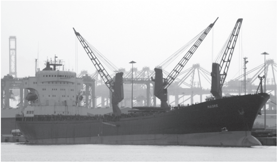
Abb. 4 OTTO HAHN nach diversen Umbauten und Umbenennungen im Jahr 2006 als MADRE.

len des GKSS-Archivs und des Bundesarchivs hervorgeht: Die Industrie in Deutschland hat keinerlei Anstalten unternommen, von sich aus ein Kernenergieschiff zu verwirklichen. Deutlich wird darüber hinaus, dass in den beteiligten Firmen jeweils nur Einzelpersonen an das Potential des Kernenergieantriebes glaubten. Auf die Geschäftspolitik ihrer Unternehmen konnten sie keinen Einfluss nehmen. Im Falle Schafstalls war es daher nur konsequent, dass er später zur GKSS wechselte. Alle theoretischen Arbeiten, die auf diesem Gebiet außerhalb der GKSS und Interatoms geleistet wurden, geschahen aufgrund der gewährten staatlichen Förderung und können nicht als Bekenntnis zur Kernenergie gewertet werden. Im Falle der A.G. »Weser« darf man annehmen, dass die Beteiligung an dem Projekt eines Katamarans nur zufällig mit der Kerntechnik zusammenfiel und vor allem dazu diente, die Stellung der Werft bei der Politik zu verbessern.