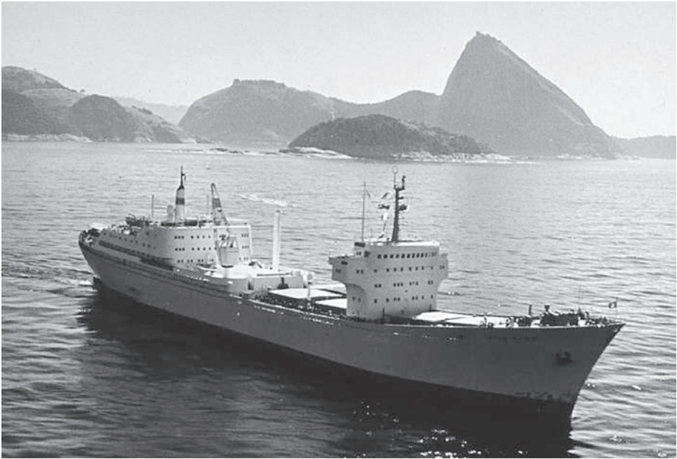
Abb. 3 Die OTTO HAHN vor Rio de Janeiro, 1975.

Versammlung kam zu dem Ergebnis, dass in der neuen Lage auf dem Energiemarkt selbst für das geplante Demonstrationsschiff bereits ein kostendeckender Betrieb erwartet werden könne. Man beschloss, dazu detaillierte Wirtschaftlichkeitsbetrachtungen anzufertigen. Auch auf ein steigendes Interesse des Auslandes am Kernenergieantrieb wurde hingewiesen. Reeder aus Großbritannien, Schweden und Dänemark hätten um Gespräche mit der GKSS gebeten. Die Zuversicht, angesichts dieser neuen politischen und ökonomischen Lage Fortschritte bei der Einführung des Atomantriebes in der Handelsschifffahrt machen zu können, wuchs nach den Rückschlägen beim Betrieb der OTTO HAHN wieder. 91