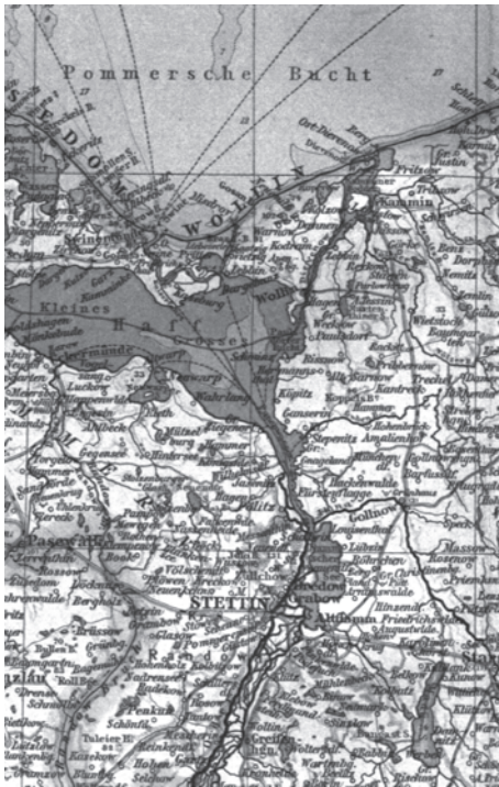
Abb. 3 Karte des Stettiner Haffs. (Ausschnitt aus: Andreas allgemeiner Handatlas. 3., völlig neu bearb. und verm. Aufl. Bielefeld 1893)

die Fock gehen. Der Käppen am Ruder ruft: »Laß die Fock gehen!« Auf Plattdeutsch reimt es sich beinahe mit »Fock runter!« Ich wiederhole und schmeiße die Fock runter. Das Schiff dreht jetzt nicht und wir knallen gegen die Steinmole. Der Käppen brüllt von hinten: »Du Döskopp!« Wogegen der Steuermann den Anker rasseln ließ und mir mit dem nächsten Tampen welche einschenkte. Da ich diese rohe Behandlung nicht gewohnt war, sprang ich auf die Mole und lief ein Ende vom Schiff fort. »Komm bloß an Bord, dann gibt's erst richtig was«, rief der Steuermann. Darauf kamen ein paar starke Männer, die dort angelten, und brachten mich zurück. Sie sagten zum Steuermann: »Wenn Du den Jungen noch einmal haust, dann bekommst du es mit uns zu tun!« Darauf hatte ich dann erst einmal Ruhe und wir segelten nach Dänemark zu.