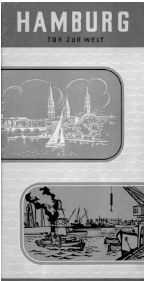
Abb. 4 Ausschnitt aus einem Prospekt des Fremdenverkehrsvereins Hamburg, um 1960, im Original farbig.

Ungefähr zur gleichen Zeit wie der Slogan »Tor zur Welt« breitete sich auch der Werbespruch »Ankerplatz der Freude« für St. Pauli aus. 84 Dieses maritime Bild entstand nun gerade deshalb, weil der Charakter des Hafenviertels in St. Pauli kontinuierlich abnahm und es deshalb vorteilhaft erschien, mit Zeichen auf die maritime Tradition zu verweisen. Trotz einiger »Säuberungsmaßnahmen« in St. Pauli während der NS-Herrschaft, wie beispielsweise gegenüber der Straßenprostitution, gab es eine Kontinuität in der maritimen Zeichenproduktion. Nur wenige Wochen vor dem Angriff der Wehrmacht auf Polen war in der Presse über entsprechende Pläne in St. Pauli zu lesen: Zu diesem Zweck denkt man an die Neuerrichtung von türkischen Mokkastuben, amerikanischen Bars, chinesischen und japanischen Restaurants, spanischen und griechischen Weinhäusern, in denen also der Besucher den Eindruck gewinnen soll, daß er in der Tat hier in einer Welthafenstadt ist. 85