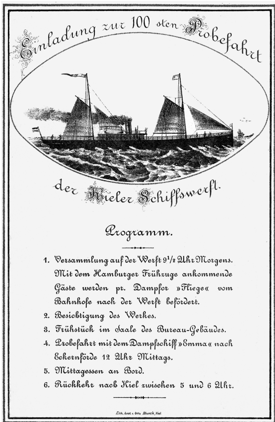
Abb. 6 Einladungskarte zur Probefahrt der EMMA.