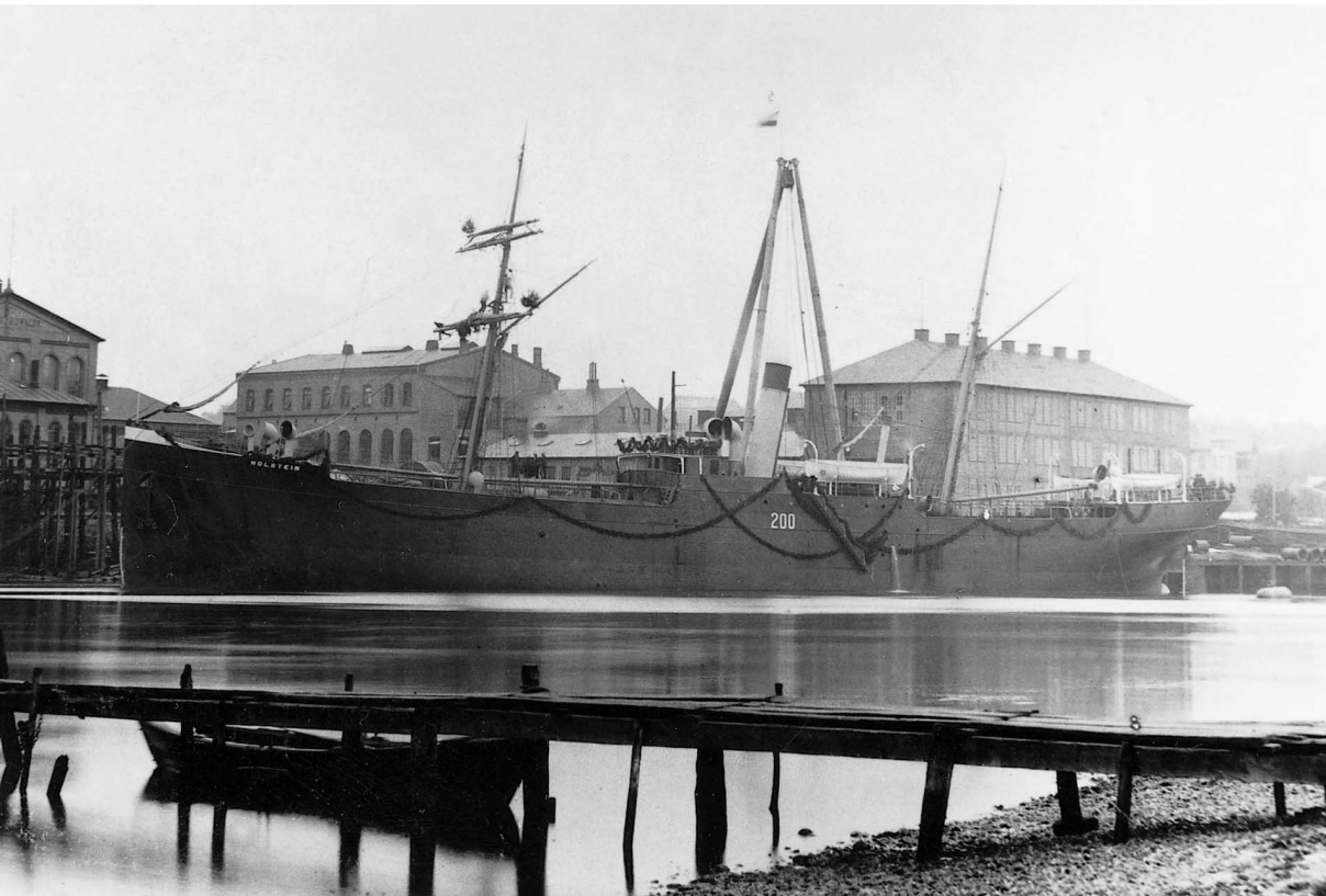
Abb. 8 Die HOLSTEIN im Herbst 1889 mit Girlandenschmuck und aufgemalter Baunummer 200 an der Ausrüstungspier in Dietrichsdorf.