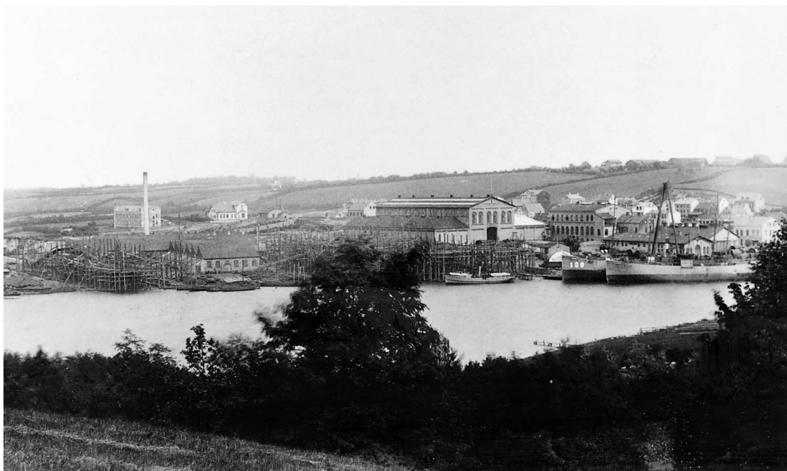
Abb. 4 Die Werftanlage, August/September 1883, rechts: EMMA in der Ausrüstung, mit der Baunummer am Vorschiff.