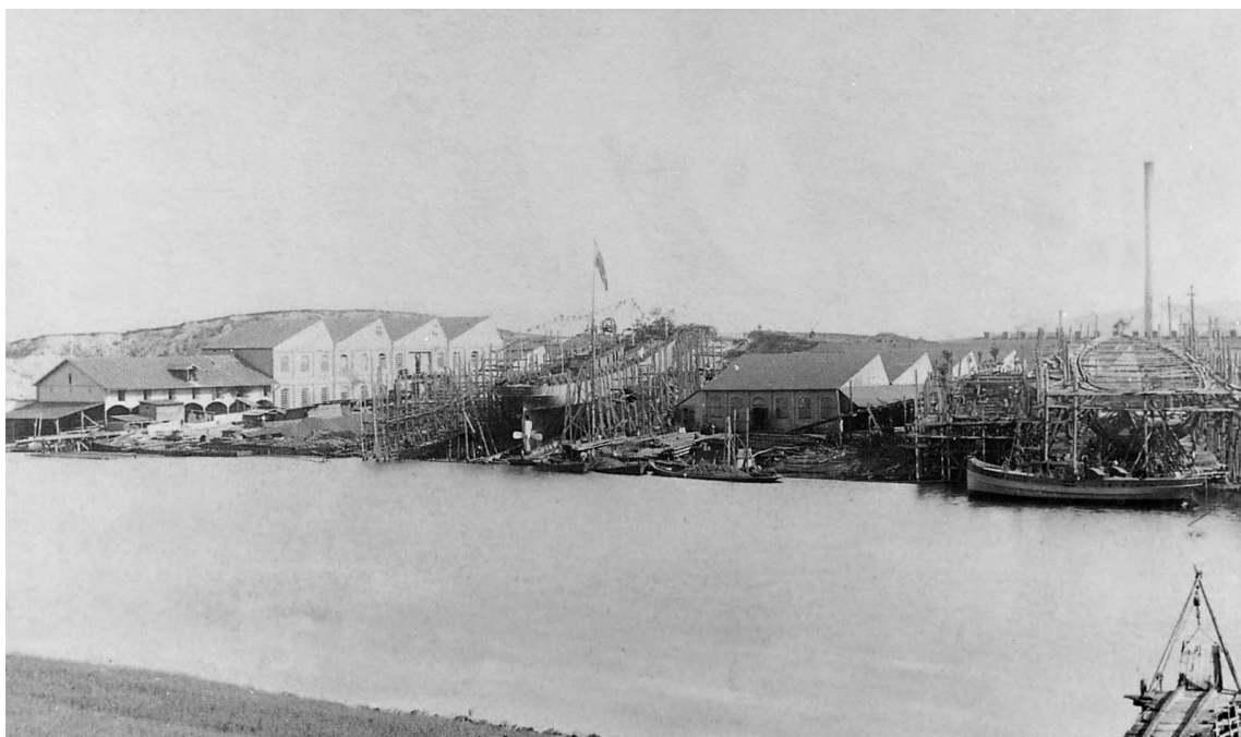
Abb. 3 Die Werftanlage am 14. August 1883, in der Mitte: EMMA auf dem Helgen.