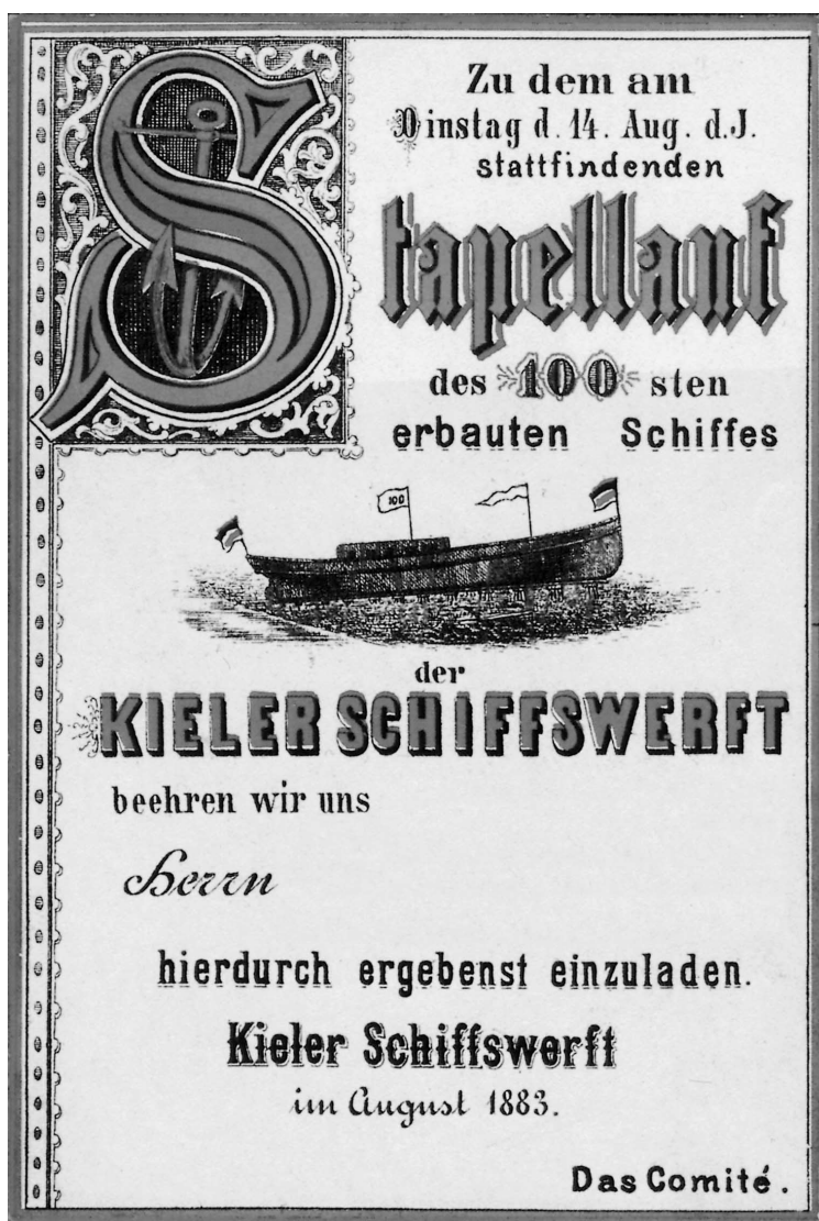
Abb. 2 Einladungskarte zum Stapellauf der EMMA.

Zu den technischen Daten der EMMA: Länge zwischen den Perpendikeln 62 m, Breite 8,2 m, Vermessung 863 BRT, 1100 Tonnen Ladefähigkeit, 1 Compoundmaschine mit Oberflächenkondensation, 320 PSi, 2 Kessel, Geschwindigkeit 8,5 Knoten. 45 Das Schiff gehörte zu einem bewährten Typ, den man bereits für Sartori & Berger, aber auch für andere Reedereien gebaut hatte, und zwar ganz offensichtlich nach einem einheitlichen Grundentwurf, der freilich Unterschiede in technischen Details und der Ausrüstung, je nach den individuellen Wünschen des Reeders, zuließ. Generell läßt sich sagen, daß man bei Howaldt in den 1880er Jahren bei Frachtern, aber auch bei Schleppern zu einer derartigen Standardisierung gekommen war, die für die Werft teure Entwicklungskosten einzusparen half. Dies betraf im übrigen auch die Installation eines einheitlichen Maschinentyps. Bei dieser Serie kam die 320 PS-Maschine, hergestellt durch die Gebrüder Howaldt, zum Einbau.