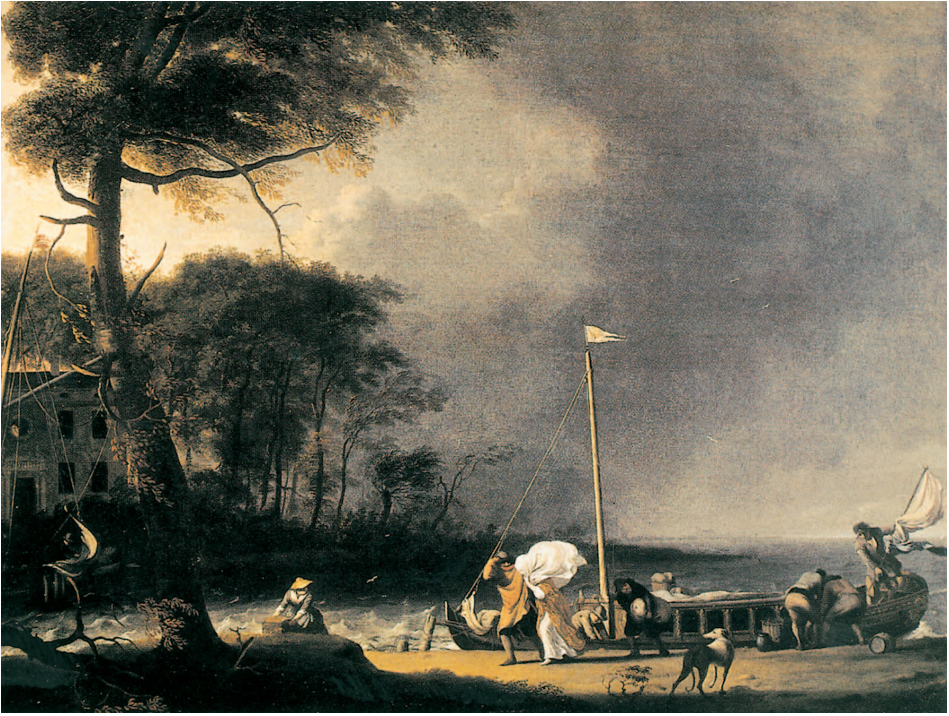
Ludolf Backhuysen: Der aufziehende Sturm. Sign. u. dat.: Ludolf Backhuysen 1682. (Staatliches Museum Schwerin)

lerischem Ehrgeiz, nur dokumentieren will: Es zeigt allein das Schiff, ohne Landschaft, ohne Staffage, ohne alles Beiwerk, fast wie einen Aufriß. Der Mast ist zwar weggelassen, die Aufschrift sagt aber eindeutig: Dese TreckJaigt is lanck 50 voet... 6 Es handelt sich um eine farbig lavierte Zeichnung, die ohne erkennbaren Zusammenhang eingebunden ist in einen Briefwechsel des Herzogs Friedrich I. von Sachsen-Gotha-Altenburg (1646-1691) mit seinen Kindern. 7 Das Bild wird der Herzog vermutlich von seinem mehrmonatigen Aufenthalt in den Niederlanden vom Frühjahr bis Herbst 1688 mitgebracht haben, bei dem er für seine vielen Besichtigungstouren laut dem Diarium seines Kammerdieners 8 oft Schiffe benutzte: Jachten, Schmacken oder Treckschuiten (der Kammerdiener schreibt Dreckschuyten ).