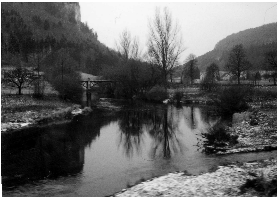
Abb. 3 Die Donau im Alb-Durchbruch bei Beuron.

Die Iller kommt von den Alpen und führt im Stadtgebiet von Ulm der bis dorthin mittelgroßen Donau soviel Wasser zu, daß die Schifffahrt im Mittelalter und der Neuzeit offiziell bei dem Stromkilometer 2588 in Ulm begann. 5 Im Mittelalter und in der Frühen Neuzeit wurde der Strom mit plumpen Frachtschiffen von einiger Größe – den sog. Ulmer Schachteln bzw. Ulmer ordinari oder Schwabenplätten befahren. 6 Vor diesem Hintergrund steht es außer Frage, daß die Donau schon zur Römerzeit an der Illermündung für größere Fahrzeuge schiffbar war.