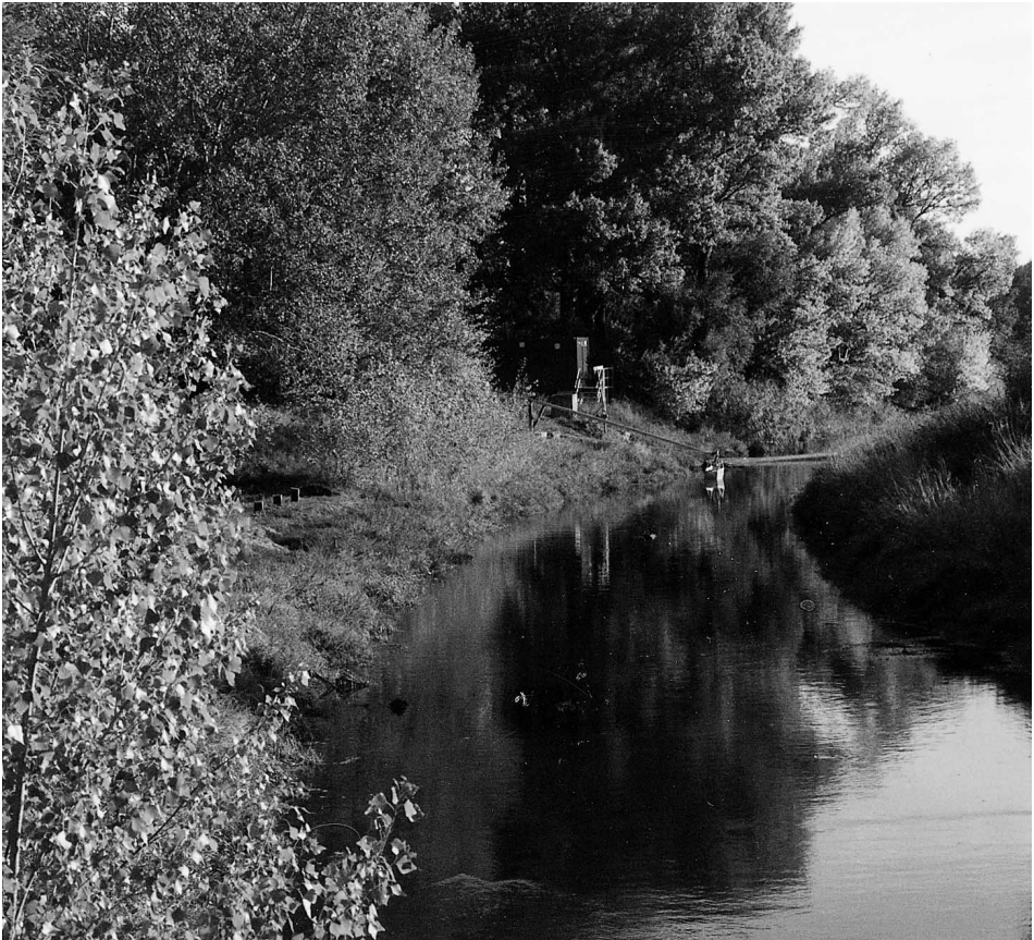
Abb. 4 Der Schwarzbach ca. 1 km oberhalb der Mündung in den Ginsheimer Rhein bei Ginsheim, Kreis Groß Gerau.

Die nautische Bedeutung der Illermündung schließt aber nicht aus, daß die Römer vor dem Alamanneneinbruch die Donau auch oberhalb von Ulm befahren haben, wenn es dafür wirtschaftliche oder militärische Gründe gab. Zur politischen Situation sei bemerkt, daß im frühen 1. Jahrhundert n. Chr. die Donau von dem Kastell Hüfingen, Schwarzwald-Baar-Kreis 19 , an, das an der Breg wenige Kilometer südlich ihrer Konfluenz mit der Brigach in Donaueschingen gelegen ist, die Grenze des Imperiums bildete. 20 Als später das Land zwischen Oberrhein und Neckar in das Reich einbezogen wurde, verlor dieser alleroberste Teil des Donaulaufs seine Grenzfunktion. Im mittleren 3. Jahrhundert brachen dann die Alamannen tief in die Westhälfte der Provinz Raetien ein und ließen sich dort nieder. Dadurch wurde die Iller zur Grenze und als Limes befestigt. Die Donaustrecke westlich der Illermündung, d.h. von Ulm, war jetzt in feindlicher Hand.