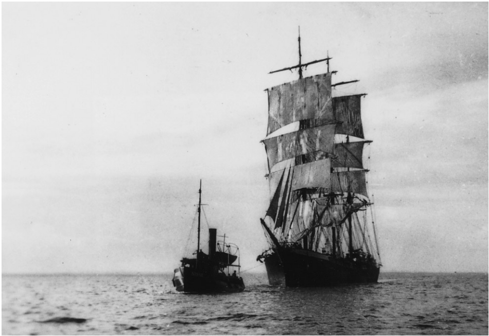
Abb. 2 Die Bark LINGARD, 1933.

Musiker, er hat in den Londoner Bierlokalen jedesmal sehr gut vorgespielt, so daß wir oft umsonst unser Bier bekamen. Ich hatte mein Bandonion von zu Hause mit an Bord gebracht und spielte darauf in meiner freien Zeit. Die Finnen und Schweden, aber auch die anderen Seemänner, waren sehr ehrliche Leute, man kannte z.B. kein Schloß an Bord. Hatte man auf der Back etwas liegen gelassen und mußte fort, so fand man es abends auf seiner Koje wieder. Im übrigen hatten wir im Logis einen Kampf gegen Flöhe. Es hieß, »wir werden nur noch gebissen, weil wir Neulinge sind«. Das Essen war zu jeder Zeit sehr gut und sehr reichlich. Kein Vergleich zu dem Dreimastgaffelschoner ANNEMARIE aus Hamburg, auf dem ich 1931 als Moses fuhr. Schon in London mußte ich öfter in die Masten. Nach kurzer Zeit saß ich auf der Nock einer Rahe genau so sicher, wie in einem Sessel zu Hause. Das galt auch auf den »Pferden«, man stand nach kurzer Zeit da so sicher wie zu Hause auf einem Perserteppich.