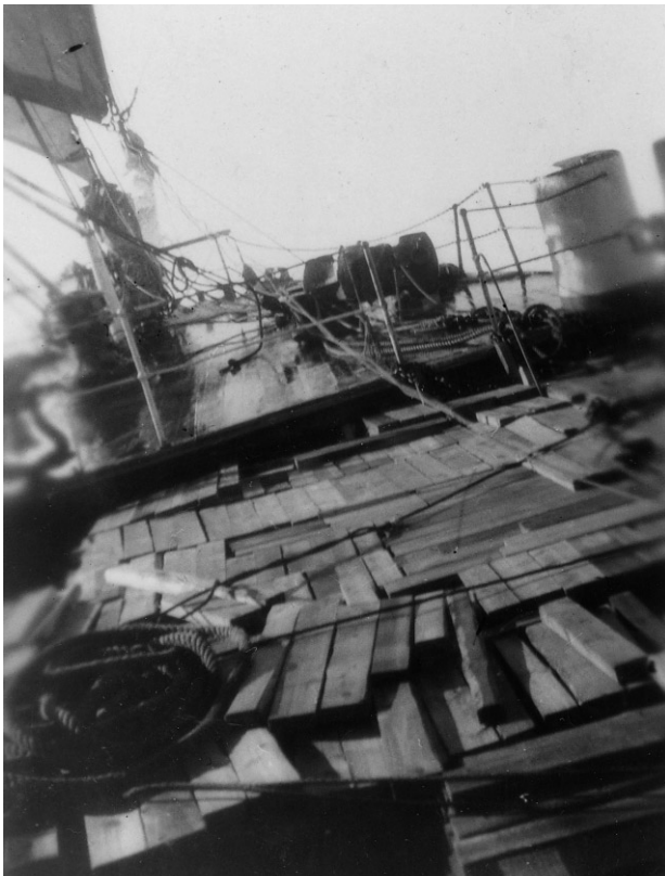
Abb. 3 Holz, bei Sturm eine gefährliche Ladung.