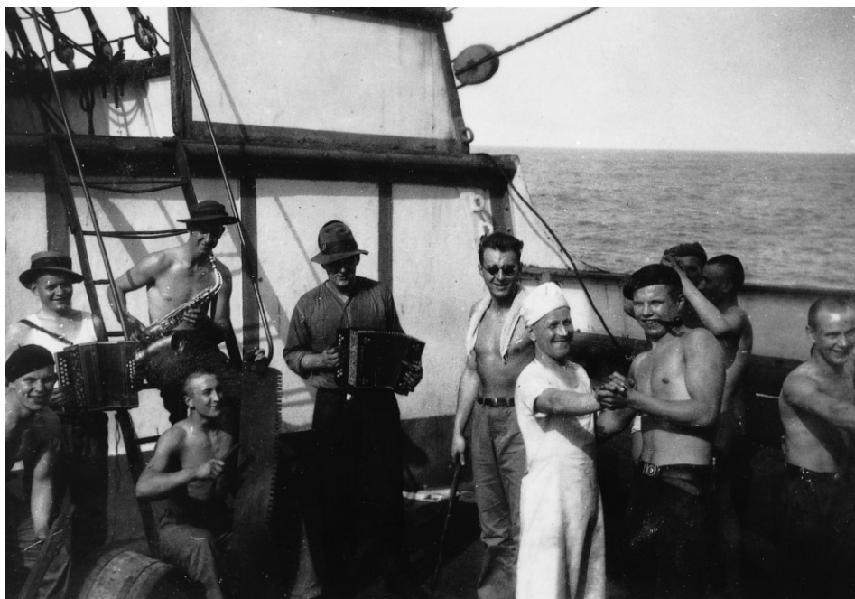
Abb. 6 Die Bordkapelle der LAWHILL spielt zum Tanz auf.

naturgemäß nicht auf. Zum Glück war das Wetter in den nächsten Tagen etwas ruhiger. Wir mußten erst ein Segel für die Fock herstellen und nähen. Das Berechnen des neuen Segels machte der Kapitän zusammen mit dem Ersten Steuermann und dem Segelmacher. Die Bahnen wurden aufgezeichnet, da jede Bahn genau mit der anderen übereinstimmen mußte. Auch das Annähen der Lieken war genau zu berechnen. Eine konzentrierte Arbeit, die Wissen und Können voraussetzte. Danach begann das Nähen des Segels durch Matrosen unter Leitung des Segelmachers. Auch der Erste Offizier überzeugte sich von den Arbeiten und ob die Nähte übereinstimmten. Das Nähen eines großen Segels nahm Tage in Anspruch. War das Segel fertig genäht, begann das Setzen des Segels. Da war die gesamte Besatzung dabei, auch der Alte war mit vorne. Als das Segel in den Schoten festgemacht und zum ersten Mal seine praktische Bewährungsprobe bestanden hatte, gab es anschließend einen aus der Buddel. Langsam kamen wir dem Südostpassat näher. Beim Außenbordmennigen fiel der Engländer über Bord, an einem Tampen wurde der arme Kerl zum Glück sofort wieder auf das Schiff geholt. 30