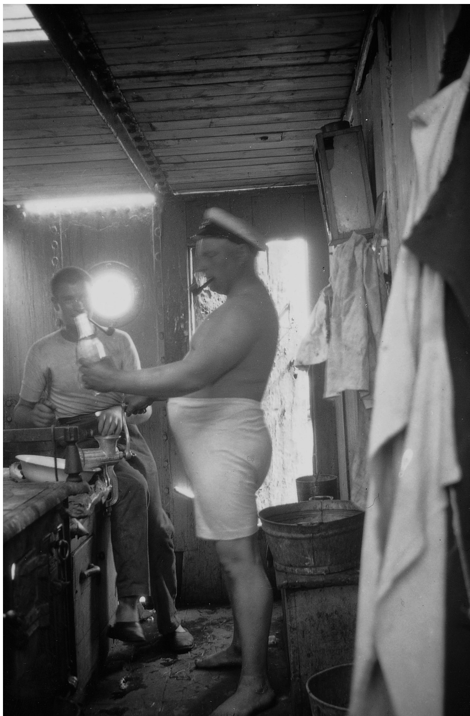
Abb. 4 Steuermann der LINGARD.