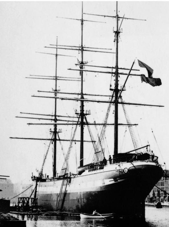
Abb. 1 Stählernes Vollschiff VONDEL.