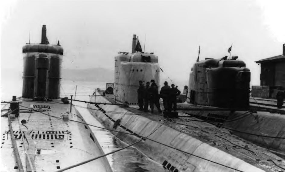
Drei Typ-XXI-Boote am Dokkeskjerkai in Bergen, Mai 1945: links U 2506, in der Mitte U 2511, an der Kaje U 3514.

hin zu prüfen und mögliche Wertungen, Deutungen und Einordnungen vorzuschlagen oder vorzunehmen. Insofern wird sich manch einer der Leser fragen, was all die mehr oder weniger schlaun Betrachtungen, in denen relativiert, klargestellt, alternativ und kontrovers argumentiert wird, denn nun konkret aussagen.