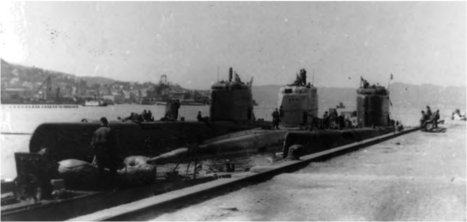
Kurz vor der Kapitulation in Bergen: U 3506, U 2511, U 3514. Im Hintergrund links der durch Kleinst-U-Boote versenkte Frachter BÄRENFELS.

Neben diesem »negativen« Verfahren soll nun ausgangs noch ein positiver Ansatz in der Form eines historischen Szenarios vorgelegt werden. Auch dieses hat aber nicht den Charakter, die Begegnung zu beweisen. Vielmehr zeigt es innerhalb sinnvoller Rahmenannahmen auf, wie der Ablauf der Einsatzfahrt von U 2511 zwanglos gewesen sein kann.