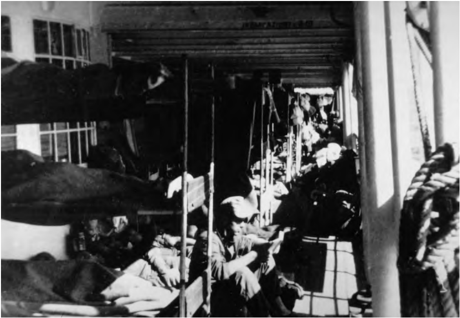
Mit Verwundeten überladen. Die GRADISCA 1944 während eines Transports.

ändern, wo ein Untersuchungskommando des Zerstörers KIMBERLY an Bord ging und die Kommandogewalt übernahm. 2 Tage später stach die GRADISCA unter Bewachung des Zerstörers TEAZER in See und ankerte am 1. November in Alexandria, wo sich bereits das kurze Zeit zuvor aufgebrachte Lazarettschiff TÜBINGEN befand. Eine britische Kontrollkommission kam an Bord, berief sich auf das Recht zur Durchsuchung, Überwachung und gegebenenfalls auch Zurückhaltung des Schiffes gemäß den Internationalen Verträgen. Der Chefarzt verzeichnete im Kriegstagebuch: Sie fordern