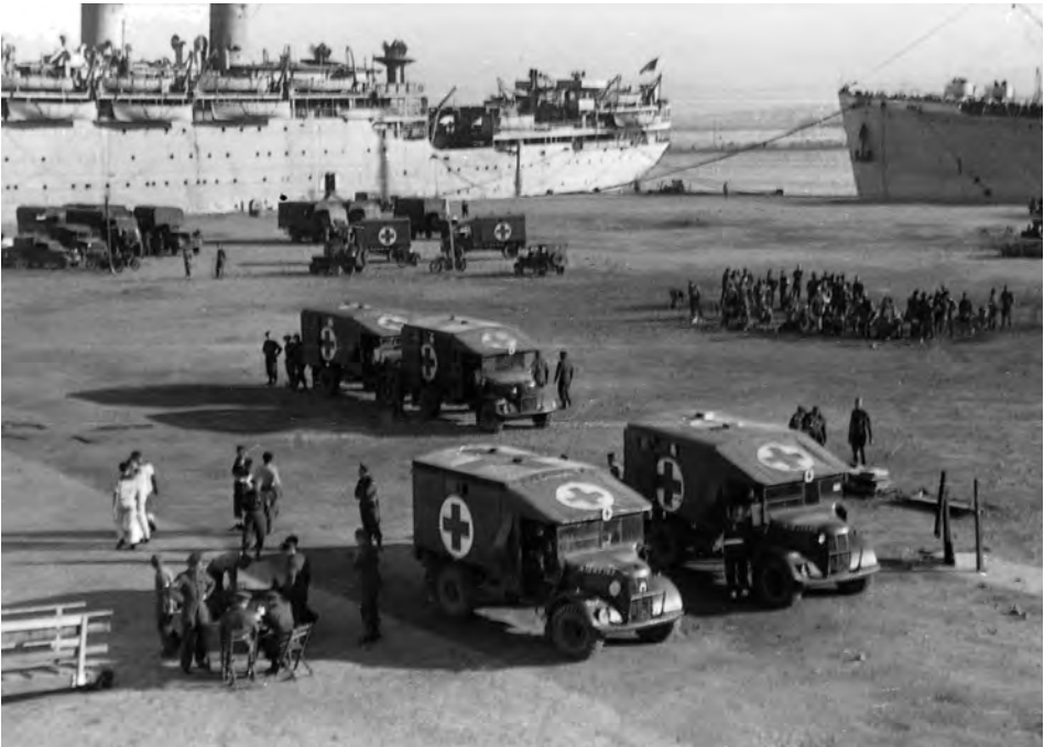
Barcelona 1944; Verwundetenaustausch. Ambulanzen im Hafengelände.