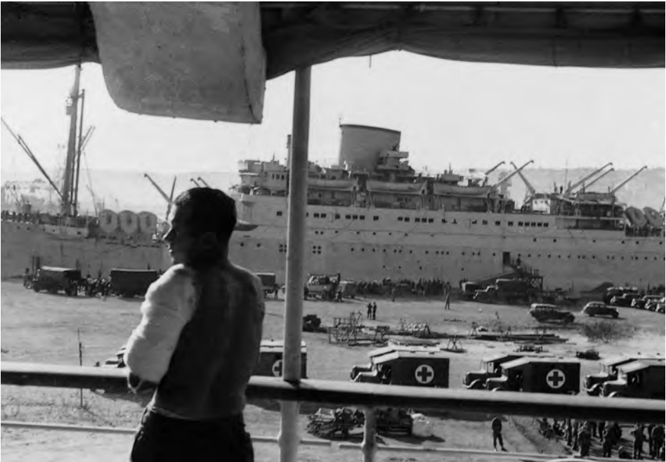
Barcelona 1944; Verwundetenaustausch. Blick von der GRADISCA auf Ambulanzfahrzeuge im Hafengelände.