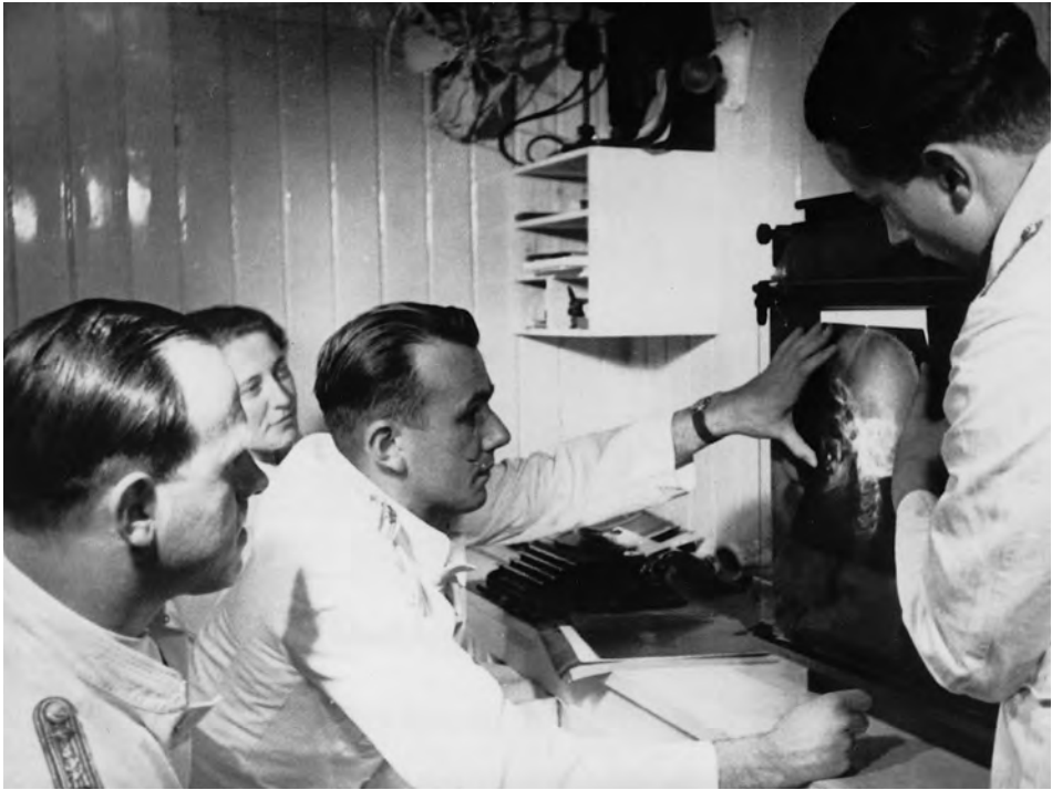
Sanitätsoffiziere der GRADISCA während der Röntgenbesprechung.

benen Ableben sowie die wochenlange Fernhaltung des Laz.Schiffes von seiner charitativen Bestimmung ... das englischerseits auf Artikel 12 und 4 des Abkommens gestützte Recht zur Einbringung der Gradisca und deren Verbringung nach zwei anderen weit voneinander entfernt liegenden Häfen nicht mehr als zulässigen Usus, sondern als einen eklatanten Abusus erscheinen [lassen], dessen Abkommenswidrigkeit auch nach dem im Jahre 1937 bei den Genfer IRK-Beratungen über die Neufassung des Lazarettschiffsabkommens von den Delegierten zu Art. 12 und 4 gemachten Ausführungen außer Zweifel stehen dürfte. 51 Allerdings findet sich in Anbetracht des Kriegsverlaufs am Ende des Dokuments der resignierende Vermerk: Die erste Kursanweisung der Gradisca durch ein engl. Uboot verdient besonders vermerkt zu werden in der Hoffnung, daß es uns nach dem Wiederaufleben des deutschen Ubootkrieges auch noch einmal vergönnt sein möge, engl. u. amerikan. Laz.Schiffe durch deutsche Uboote in Häfen des deutschen Machtbereiches zwecks Herunternahme aller Engländer und Amerikaner dirigieren zu können. 52 Angesichts der zahlreichen anglo-amerikanischen Übergriffe auf deutsche Lazarettschiffe im Mittelmeer bereitete die Seekriegsleitung noch im Januar 1945 eine Übersicht derartiger Vorkommnisse auf. 53