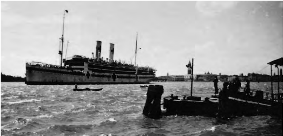
Das Lazarettschiff GRADISCA läuft 1944 aus Venedig aus. Im Hintergrund sind Dogenpalast, Campanile und Rialto-Brücke zu erkennen.

waren die britischen Behörden zu diesem Zeitpunkt noch nicht interessiert. Trotzdem schlug dieser erste Zugriff auf ein deutsches Lazarettschiff durch alliierte Kriegsschiffe einige Wellen, da u.a. auch von der Seekriegsleitung gefragt wurde, weshalb überhaupt britische Gefangene auf dem unsicheren Seeweg in die Adria mitgeführt wurden. Auf jeden Fall mußte die S.K.L. schließlich konstatieren, daß der gegnerischen Seite nach Artikel 12 des Lazarettschiff-Abkommens das Recht zugebilligt werden mußte, die Herausgabe der auf deutschen Lazarettschiffen befindlichen Verwundeten, Kranke und Schiffsbrüchigen zu verlangen, und zwar nicht nur der eigenen Nationalität, sondern durchaus auch der des Feindstaates, ein Umstand, der im darauf folgenden Jahr eine große Aktualität gewinnen sollte.