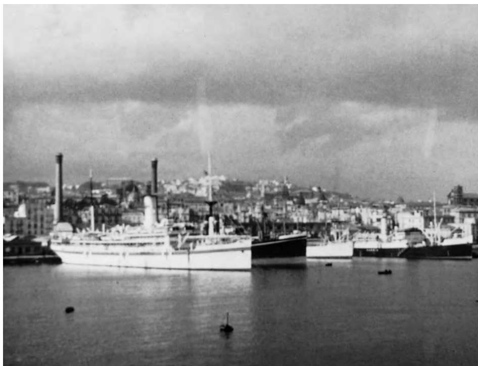
Blick aus der Hafeneinfahrt Palermo in den Vorhafen auf das Lazarettschiff AQUILEA 1938/39.

Vor Eintritt Italiens in den Zweiten Weltkrieg am 11. Juni 1940 bis zum Ausscheiden durch den Waffenstillstand am 8. September 1943 unterhielt Italien eine Flotte von Großen, Mittleren und Kleinen Lazarettschiffen, die allerdings bei Ausbruch der Feindseligkeiten erst eingerichtet und umgebaut werden mußten. Das Schicksal dieser Schiffe ist von dem italienischen Tenente Generale Medico (Generalarzt) Mario Peruzzi 1952 aufgezeichnet worden. 1 Von den 19 eingesetzten Lazarettschiffen gingen acht durch Kriegseinwirkung verloren. Im unermüdlichen, pausenlosen und häufig sehr gefährlichen Einsatz haben diese schwimmenden sanitätsdienstlichen Einrichtungen 596 Fahrten absolviert und zusätzlich 115 Einsätze zur Rettung Schiffbrüchiger durchgeführt. Nach Angaben Peruzzis konnten in diesem Rahmen mehr als 250 000 Kranke, Verletzte und Verwundete aus dem Mittelmeerraum nach Italien repatriert werden. 2 Zwei der italienischen Großen Lazarettschiffe, die AQUILEA und GRADISCA, wurden ab Oktober 1943 von deutscher Seite in dieser Funk-