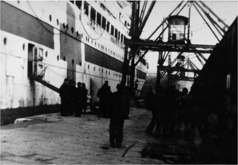
GRADISCA an der Pier in Triest 1944/45.