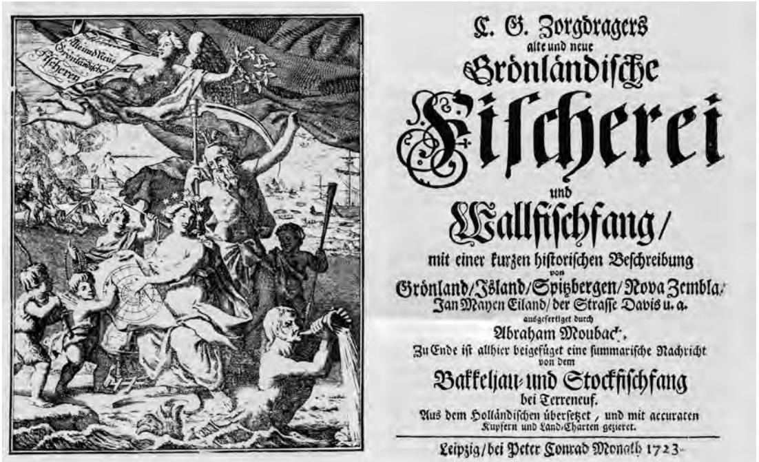
Abb. 1 Titelkupfer und Titelblatt der deutschen Ausgabe von Cornelis Gijsbertus Zorgdragers großem Werk über den Grönlandwalfang von 1723. Die Abhandlung wurde erstmals 1720 in niederländischer Sprache in Amsterdam veröffentlicht.

Jong 7 , Pieter Dekker 8 , Louwrens Hacquebord 9 und Jurjen Leinenga 10 . In diesem Zusammenhang sei vor allem ein Aufsatz Dekkers erwähnt, der den Föhler Seeleuten auf niederländischen Walfängern besondere Aufmerksamkeit schenkt. 11 Einen wertvollen Beitrag über die Bedeutung Hamburgs für die Föhler Walfänger liefert Harald Voigt, der durch die Auswertung der Abmusterungsprotokolle des Hamburger Wasserschouts sehr hilfreiches statistisches Material liefert. 12