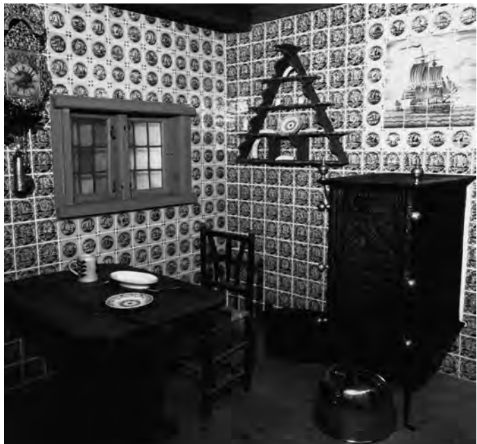
Abb. 7 Die Wohnstube eines nordfriesischen Walfangkommandeurs aus der Zeit um 1780 in der Ausstellung des DSM.

Vergleicht man die Zahl der nachgewiesenen Föhrer Kommandeure mit der Zahl der Ausfahrten, so zeigt sich, daß diese nur einen geringen Anteil der Walfangkommandeure ausmachten 106 , da bis 1703 die Zahl der Ausfahrten selten unter vierzig, sondern in der Mehrzahl der Jahre deutlich über fünfzig lag, die Zahl der Föhrer Kommandeure jedoch zwischen null und drei schwankte. Erst für die Zeit nach 1750 konnte Voigt aufgrund der verbesserten Überlieferungssituation der Quellen genauere Werte ermitteln. Dabei konnte auch zwischen der ab 1720 relevanten Einteilung als Wal- oder Robbenfänger differenziert werden. Zwischen 1750 und 1755 stellte Föhr mit sechs beziehungsweise sieben Komman-