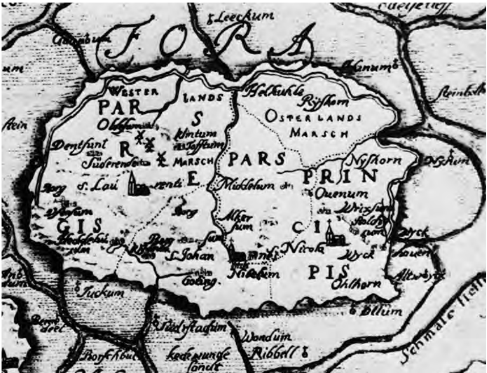
Abb. 6 Die Insel Föhr im 17. Jahrhundert. (Aus: Erich Riewerts/Brar C. Roeloffs: Föhrer Grönlandfahrer . Neumünster 1996, S. 264; Ausschnitt aus einer Karte von Johann Mejer)

Für die Dominanz der Holländer im Walfang spricht, daß diese »Hollandisierung« nicht nur auf niederländischen, sondern auch auf deutschen und dänischen Schiffen beibehalten wurde. Zunächst muß geklärt werden, welche Motive zu einem Wechsel von einer wie auch immer gearteten Erwerbstätigkeit auf der Insel zu einer im Walfang führten, zumal diese Erwerbstätigkeit eine zumindest saisonale Migration mit den damit verbundenen Umständen voraussetzte. Hier kann man zwischen zwei verschiedenen Kategorien von Motiven unterscheiden, nämlich zwischen Push- und Pull-Faktoren. Unter Push-Faktoren sind in diesem Fall Faktoren zu verstehen, die eine Erwerbstätigkeit auf Föhr unattraktiv erscheinen ließen. Dazu zählen sicherlich fehlende oder unzureichende Erwerbsmöglichkeiten. So sieht beispielsweise Voigt, sich auf Hansen beziehend 81 , den Beginn der nordfriesischen, und damit auch der Föhrer Grönlandfahrt durch die Flutkatastrophe vom 1.10.1634 aus-