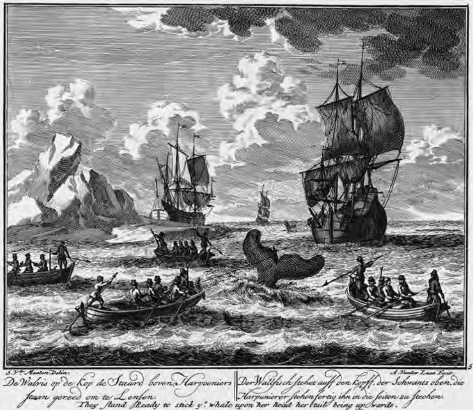
Abb. 4 »Der Wallfisch stehet auff den kopff, der Schwantz oben, die Harpunierer stehen fertig ihn in die seiten zu stechen.« Stich von Adolf van der Laan zur Grönlandfahrt, um 1720.

stig gesehen in Grenzen 48 , oft waren es aber bestimmte Jahre, in denen mehrere Schiffe verloren gingen, wie beispielsweise 1769 und 1777, die als katastrophal empfunden wurden. 49