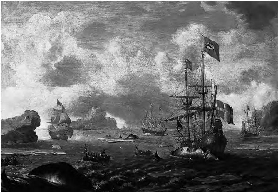
Abb. 9 Walfänger bei Spitzbergen, um 1685. Gemälde von Johann Georg Stuhr. (Sammlung Bruhn im DSM)

Schiff erbeuten konnte (insgesamt 23 Wale). 157 Dies hing sicherlich zusammen mit mangelnder Kenntnis der Fanggründe und Eisverhältnisse in der Davisstraße, da die Föhrer Kommandeure und Seeleute nur selten über Erfahrungen in diesem Fanggebiet verfügten. Auch in den folgenden Jahren waren die Fangergebnisse sehr unbefriedigend, so daß 1788 eine königliche Kommission ins Leben gerufen wurde, um die Profitabilität des KGH und den Sinn einer Aufrechterhaltung des Fangmonopols auf Grönland zu prüfen. Die Kommission gelangte zu dem Ergebnis, daß der Walfangbetrieb allein zwischen 1781 bis 1787 einen Verlust von insgesamt 107 125 Reichstalern verursacht hatte. 158 Nachdem bereits keine Schiffe mehr für den Winterwalfang 1788/89 ausgerüstet worden waren 159 , verkaufte der KGH im Jahr 1789 13 seiner Walfangschiffe und beschränkte sich fortan auf Küstenwalfang, der von den errichteten Fangstationen in den Kolonien in Zusammenarbeit mit den Grönländern betrieben wurde. 160 Dies war das Ende der kurzen Beteiligung des KGH an der Grönlandfahrt. Aus der Untersuchung von Riewerts/Roeloffs wird jedoch deutlich, daß ein Teil der Föhrer weiterhin in den Diensten des KGH beschäftigt blieb, in der Regel auf Versorgungsschiffen für die Niederlassungen auf Grönland. So gestaltete sich der Übergang vom Walfang zur Handelsfahrt, der von einem Teil der Föhrer bereits früher vollzogen worden war, in diesem Fall problemlos.