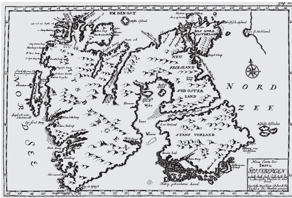
Abb. 5 Trotz sinkender Aussichten blieb das Eismeer bei Spitzbergen das traditionelle Fanggebiet. (Aus: Cornelius C. Zorgdrager: Alte und neue Grönländische Fischerei und Walfischfang . Nachdruck der Ausgabe von 1723. Kassel 1975, Bl. 111)

Zeitgenössische Quellen zeigen, daß eine Ausfahrt erst durch den Fang von mindestens vier ausgewachsenen Walen profitabel wurde. 57 Daraus läßt sich schließen, daß sich die Grönlandfahrt in diesen ersten Jahren in der Gesamtschau ohne Zweifel rentierte und daß es zwar für einzelne Schiffe und Reeder verlustreiche Fangsaisons gab, diese aber durch erfolgreichere Ausfahrten ausgeglichen werden konnten. Zwischen 1685 und 1719 wurden die Schwankungen bei der Zahl der jährlich gefangenen Wale noch größer. Sie bewegte sich gemittelt zwischen 0,4 und 10,2 Tieren pro Ausfahrt, wobei der Durchschnittswert für