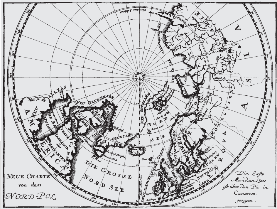
Abb. 2 Die Fanggebiete: Grönland und Spitzbergen auf einer Karte von 1723. (Aus: Cornelis G. Zorgdrager: Alte und neue Grönländische Fischerei und Wallfischfang . Nachdruck der Ausgabe von 1723. Kassel 1975, Bl. 23)

Zwei Schiffe der »Muscovy Company« waren es dann im Jahre 1611, von denen aus der erste Grönlandwal vor Spitzbergen erlegt wurde. 32 Der Umstand, daß dieser Wal von baskischen Seeleuten harpuniert und verarbeitet wurde, verweist auf das für diesen Zeitraum noch unverzichtbare Fachwissen aus der baskischen Walfangtradition. Aus diesem Grund ist auch von dem eigentlichen Beginn europäischen, industriellen Arktiswalfangs zu sprechen 33 , denn in technischer Hinsicht sind bis zum Beginn des 19. Jahrhunderts kaum wirkliche Innovationen im Bereich der Fangmethoden festzustellen. Vielmehr ist in organisatorischem und ökonomischem Sinn dieses Ereignis als eine Zäsur zu betrachten: Zum ersten Mal wird hier nämlich Walfang von einer mit erheblichem Kapital ausgestatteten Gesellschaft betrieben, die, dem merkantilistischen Geist der Zeit entsprechend, durch staatliche beziehungsweise königliche Privilegien geschützt wird. 34