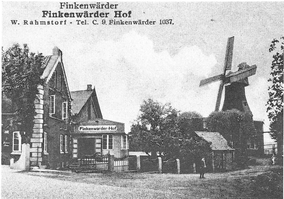
Der »Finkenwärder Hof« 1930. Postkarte