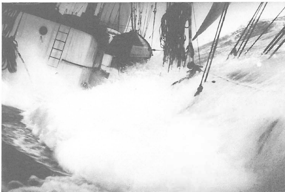
Abb. 3 PONAPE im Sturm, 1935.

Noch bevor der Versailler Vertrag in Kraft trat, wurden einige deutsche Schiffe mit Erlaubnis des alliierten »Shipping Controllers« in Fahrt gesetzt, um wichtige Aufgaben zu erfüllen. Da war zum Beispiel die Viermastbark PAUL der Reederei Krabbenhöft & Bock, die 1919 nach