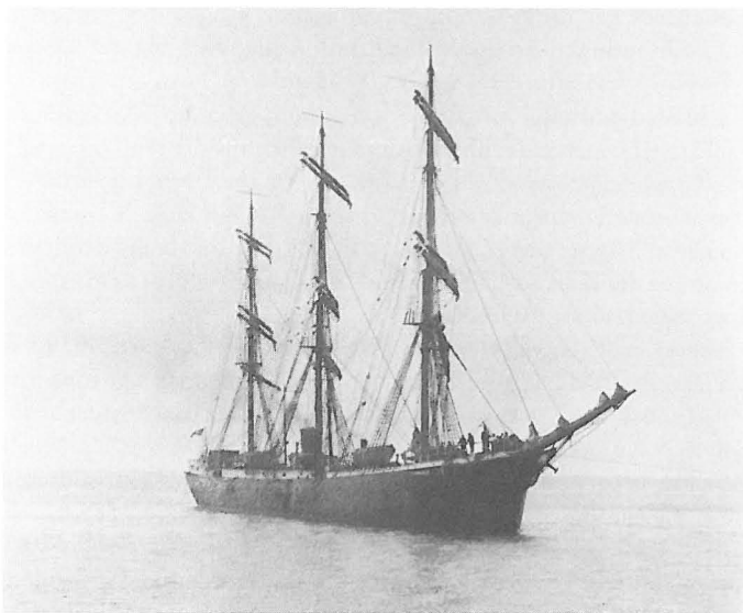
Abb. 1 Vollschiff TONAWANDA ex INDRA.

dürftige Informationen von einem anderen Schiff, dem sie zufällig begegneten. In einigen Fällen konnte ein Kapitän aufgrund solcher Informationen den Kurs ändern und einen neutralen Hafen erreichen. Ein Beispiel dafür liefert das Vollschiff INDRA, das im Oktober 1914 mit einer Salpeterladung das Seegebiet vor dem Ärmelkanal erreichte und erst dort von anderen Schiffen vage Nachrichten von einem Krieg erhielt. Als der Kapitän abends den suchenden Scheinwerferstrahl eines Kriegsschiffes sah, ging er kurzentschlossen auf NW-lichen Kurs und segelte sein Schiff in einer strapaziösen Reise nach New York, das er am 8. November nach einer 150tägigen Fahrt von Chile erreichte. Die INDRA lag dort gut bis zum April 1917, als die USA Deutschland den Krieg erklärten und die INDRA beschlagnahmten; als TONAWANDA wurde sie in das amerikanische Schiffsregister eingetragen.