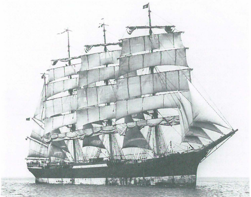
Abb. 4 Viermastbark PRIWALL.

Bord; sie wollten in die USA, wurden aber von der Kanalpolizei daran gehindert. (Siehe den Bericht »LUCIE WOERMANN und die Salpetersegler« in Stallings maritimem Jahrbuch 1975/76).