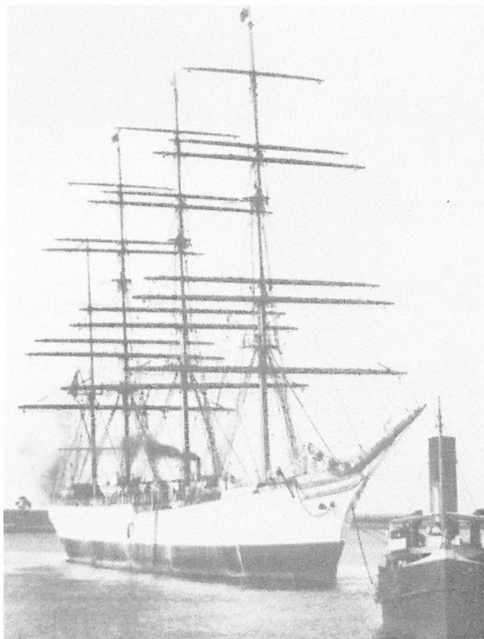
Abb. 5 Viermastbark HERZOGIN CECILIE, 1909. Postkarte

89 Tagen nach Ostende und Antwerpen. Jedoch zehn von den insgesamt 47 Schiffen brauchten mehr als 150 Tage bis zu ihrem Bestimmungshafen. Die lange Dauer der Reisen ist nicht nur auf die teilweise minderwertigen Mannschaften, sondern auch auf den schlechten Zustand der Schiffe und schließlich auch auf ungünstige Großwetterlagen zurückzuführen, in die die Mehrzahl der Schiffe hineingeriet. Letzteres passierte auch der neuen Viermastbark PRIWALL der Reederei F. Laeisz, die zur gleichen Zeit ihre erste Heimreise von Chile machte, für die sie 121 Tage brauchte. Der Reeder und sein Inspektor Boye Petersen waren sehr enttäuscht über die lange Reise ihres neuen Schiffes, so daß sie ihren Unmut auch den Kapitän fühlen ließen.