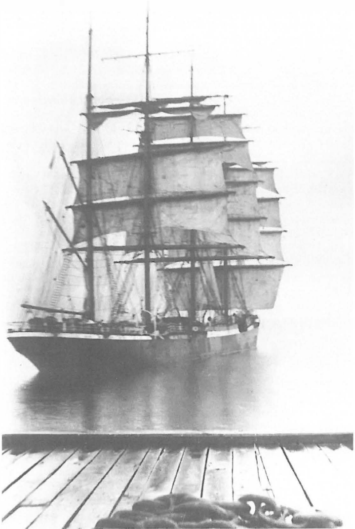
Abb. 7 Viermast- bark PASSAT, 1933.

seinen irischen Bestimmungshafen Cork ansteuerte und durch einen schweren Sturm gezwungen wurde, nach Dublin auszuweichen. Da kein Schlepper aus dem Hafen kam, versuchte Kapitän Volquardsen ohne fremde Hilfe einzulaufen, was leider mißlang. Das Schiff wurde schwer beschädigt, so daß es nach der Besichtigung im Dock kondemniert wurde. Die Besatzung war vollständig gerettet worden. Das Vollschiß OLDENBURG segelte als Frachtschulschiß unter der Regie von H.H. Schmidt bis Dezember 1927, meistens nach der Westküste Südamerikas, und wurde dann nach Bremen verkauft, wo unter der Führung des Norddeutschen Lloyd die »Seefahrt-Segelschiffsreederei GmbH« gegründet worden war. Dieselbe Reederei kaufte etwa zur gleichen Zeit auch die aus Frankreich stammende Bark LISBETH von H.H. Schmidt, nannte sie BREMEN und richtete sie ebenfalls als Frachtschulschiß ein. Der Reeder H.H. Schmidt, dessen Vollschiß BERTHA schon 1924 im Nordatlantik verschollen