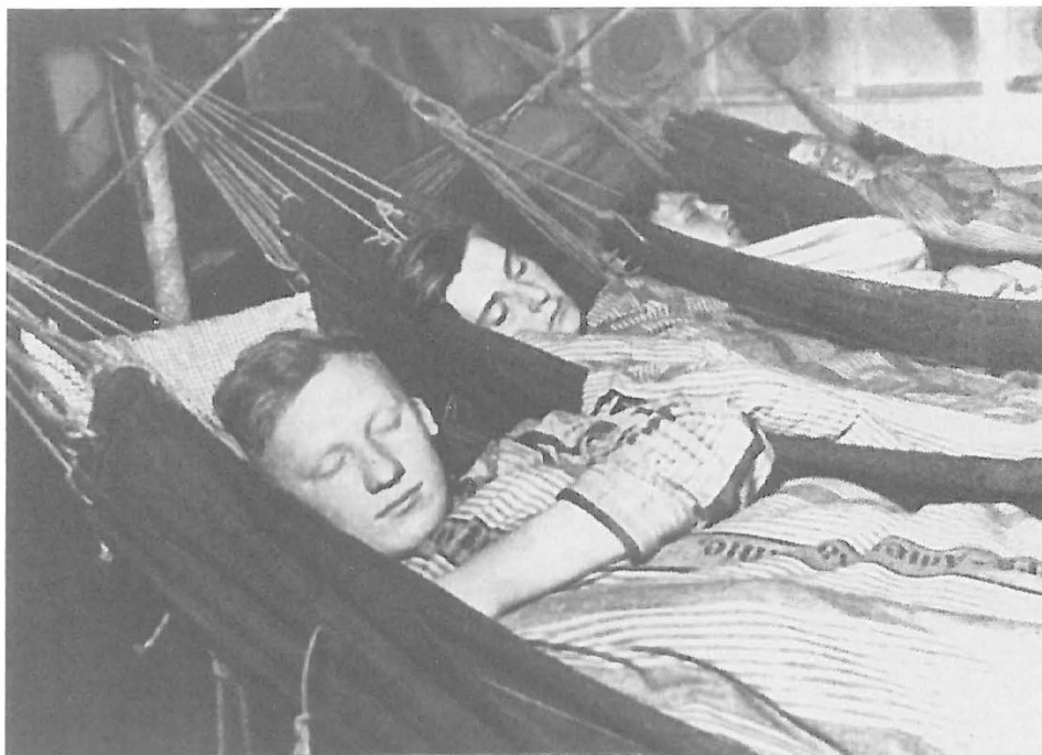
Abb. 6 Schulschiffkadetten.

man die vier Laeisz-Segler für die Nachwuchs-Ausbildung heranzog, galt in Deutschland die Vorschrift, daß die angehenden Schiffsoffiziere für den Erwerb des Steuermannspatentes unter anderem eine Fahrzeit als Decksmann von mindestens 20 Monaten auf Segelschiffen nachweisen mußten.