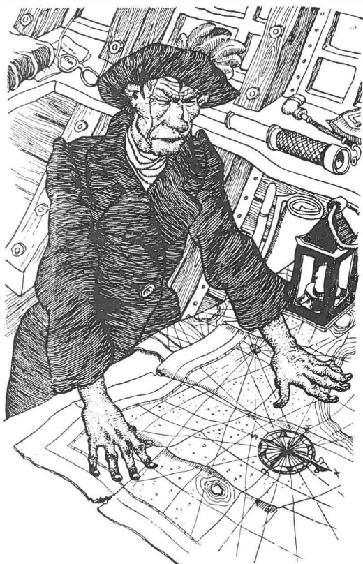
Abb. 3 Ahab am Kartentisch. (Aus: Illustrationen zu Melvilles Moby Dick, J. Kruse, S. 63, Landesmuseum Schleswig, 1976).

las man Washington Irving's Novelle »The Storm Ship« (1823) und von James Fennimore Cooper »The Pilot« (1823) und »The Red Rover« (1828). Alle diese Bücher dienten Melville wahrscheinlich als Anregung für seine lebhafteste Phantasie.