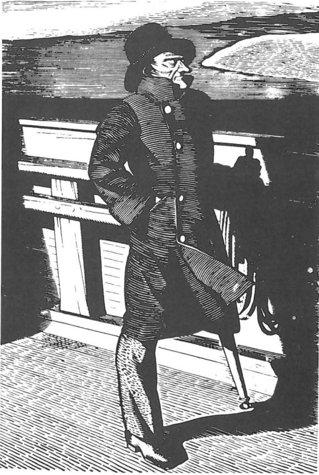
Abb. 2 Kapitän Ahab (Zeichnung von Rockwell Kent, 1930). Stolz und finster steht der einbeinige Schiffer viele Stunden lang auf dem Deck der PEQUOD und späht nach Moby Dick. (Aus: Illu- strationen zu Melvilles Moby Dick, J. Kruse, S. 14, Landes- museum Schleswig, 1976).