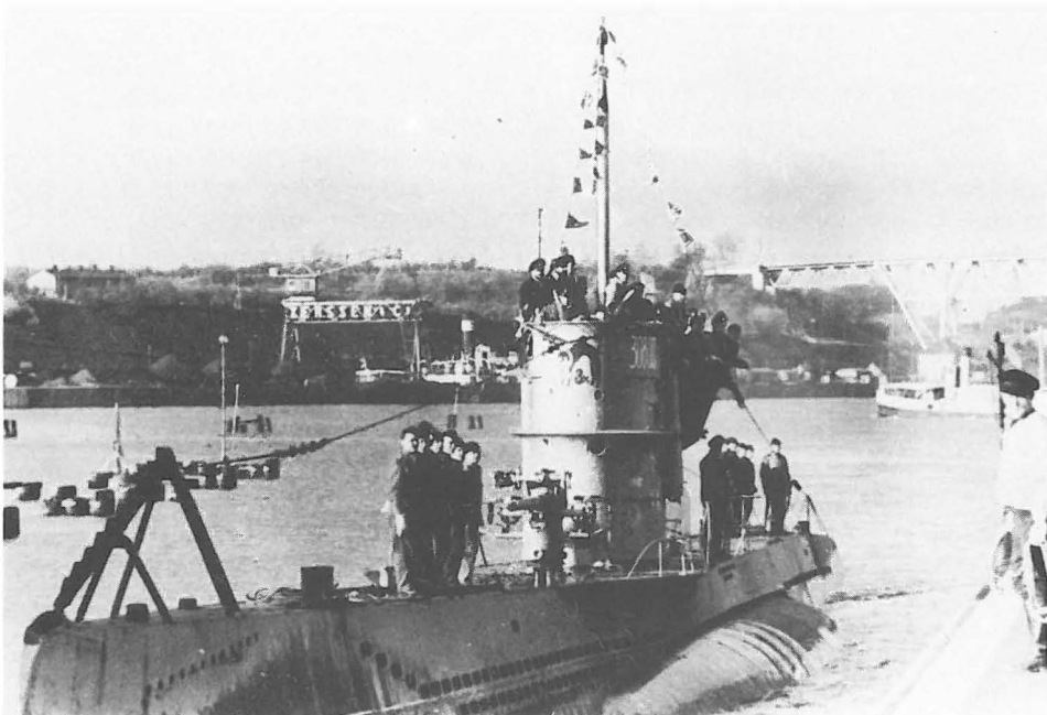
27.10.1940: Nach Passage des Kaiser-Wilhelm-Kanals (im Hintergrund links die Zerssen-Bunkerstation, rechts die Holtener Hochbrücke) macht das Boot unter Kapitänleutnant Bleichrodt um 10.45 Uhr an der Tirpitz-Mole fest zur Durchführung dringender Reparaturarbeiten.