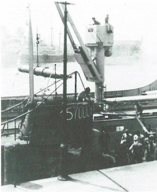
Juli 1940: U-48 gibt in Kiel Torpedos an einen längsseit liegenden Prahm ab.